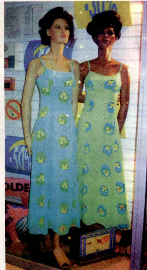
Controlar o estoque é fundamental

Se você tem loja de confecções, atualizou o estoque mas ainda tem produtos da 'grade' anterior, é importante que procure acelerar a venda deles, o que pode ser feito através de descontos. A equipe de vendas precisa estar bem treinada para convencer o freguês de que aquele é o último artigo de uma série e que por causa disso, está com o preço reduzido. Nesse caso, a promoção permanente pode ser uma boa estratégia, recomenda o consultor, que faz questão de prevenir: é preciso discrição na hora de anunciar tais descontos. É preciso deixar o cliente perceber que se trata do último número do produto e que ele teve a sorte de adquiri-lo.